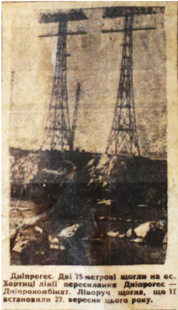
Дніпрогес. Дві 75-метрові щогли на ос. Хортиці лінії пересилання Дніпрогес — Дніпрокомбінат. Ліворуч щогла, що її встановили 27. вересня цього року.