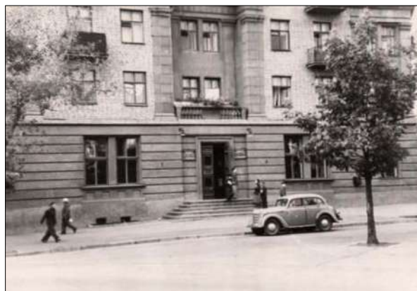
Приміщення Запорізької обласної бібліотеки на вул. Лобановського

І тільки у 50-ті роки минулого століття бібліотечне краєзнавство почало відроджуватися по-справжньому. Імпульсом його розвитку стало створення фундаментального 26-ти томного видання «Історія міст і сіл Української РСР», у тому числі і Запорізької області. Це викликало інтерес і привернуло велику увагу до вивчення місцевої історії, до пошукової, науково-дослідницької краєзнавчої діяльності значною кількістю професіоналів і любителів.