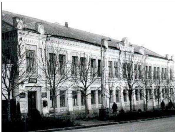
Одне з перших приміщень бібліотеки

Бібліотечне краєзнавство в нашому краї має давні традиції. Бібліотеки навчальних закладів, науково-просвітницьких товариств та приватних осіб завжди, поруч із навчальною, науковою, художньою, церковною літературою, збирали та зберігали хроніки місцевих подій, статистичні матеріали.