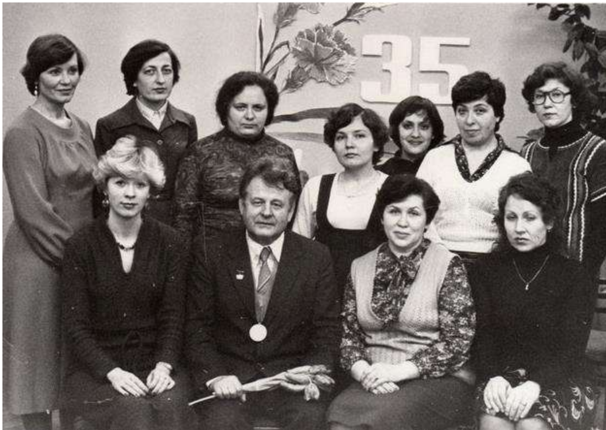
Працівники довідково-бібліографічного відділу, 1982 р.